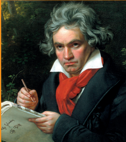
Porträt Beethovens mit der Partitur zur Missa solemnis , gemalt von Joseph Karl Stieler, 1820