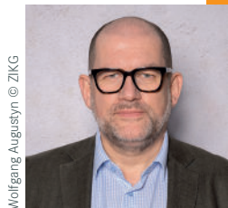
Wolfgang Augustyn © ZIKG