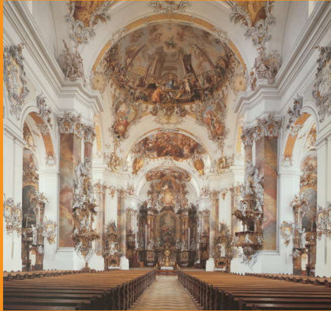
Foto: Ottobeuren, Abteikirche, Bau von Johann Michael Fischer, 1748–1760 © B. Schütz, München