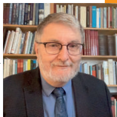
Franz Körndle © privat