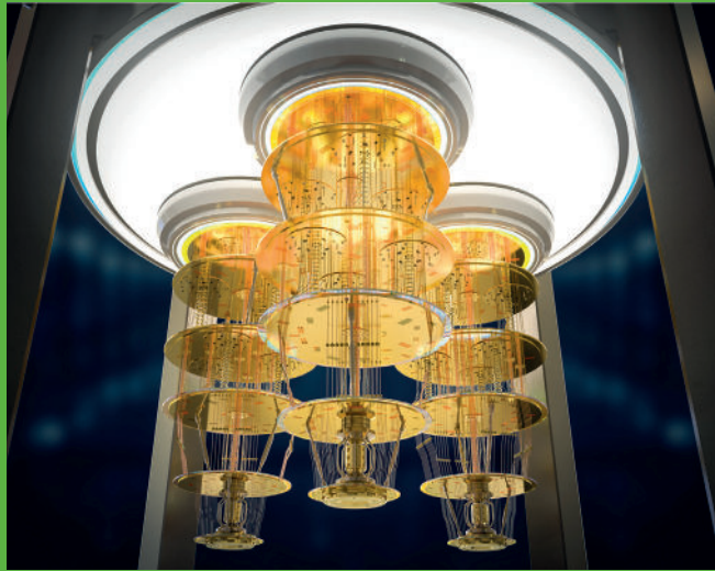
Bild: 3D-Darstellung eines Quantencomputers in einer Schutzkapsel im Labor