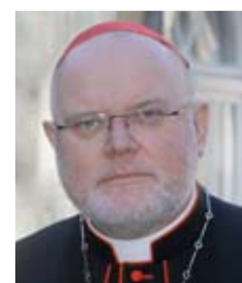
Kardinal Reinhard Marx forderte, dass Deutschland in der Frage der nuklearen Abrüstung klare Positionen bezieht.

Das gesamte Podiumsgespräch – inklusive der Begrüßung – können Sie eins zu eins nachhören. Wir haben es sowohl als Video-Clip https://www.youtube.com/watch?v=nF12aNbAocM als auch als Audio https://www.youtube.com/watch?v=WsZghUrsNOg in den entsprechenden YouTube-Kanal eingestellt. Im Video-Kanal finden Sie zusätzlich einen Kurzclip https://www.youtube.com/watch?v=NTPr5M9_izI mit prägnanten Aussagen der Diskutanten und Meinungen aus dem Publikum.