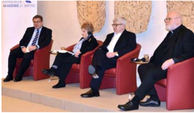
Mehr als eine Stunde wurde intensiv diskutiert. Das Podium ging auch auf Einwürfe aus den Reihen der Zuhörer und Zuhörerinnen ein.