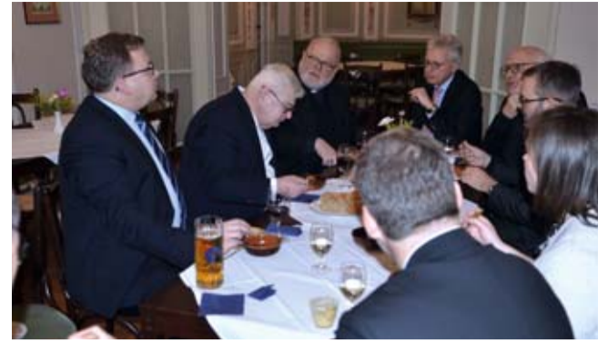
Nach dem Podiumsgespräch setzten sich Teilnehmer der Veranstaltung noch zusammen und diskutierten weiter.

gegen Atomwaffen gefunden. Zugleich versuche er, die Vertreter verschiedener Religionen dafür zu gewinnen, sich für den Frieden einzusetzen. Doch viele Rechtsextreme hätten dem Papst verübelt, dass er sich etwa in Abu Dhabi mit Muslimen getroffen habe. „Was wir brauchen, ist eine Partnerschaft“, sagt Albright – auch wenn Multilateralismus in den USA eher abgelehnt werde.