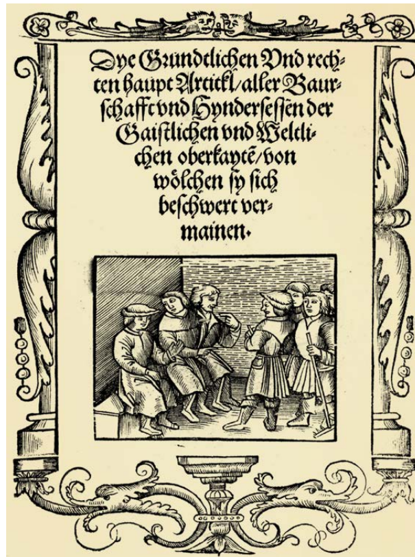
In Memmingen wird heute eine der Originalurkunden der Zwölf Artikel (hier das Titelbild) im Stadtarchiv aufbewahrt.

Demokratie wurde im Protestantismus daher weniger zuerst theoretisch begründet als praktisch gelernt. Gerade das macht den protestantischen Beitrag ambivalent, aber nicht unbedeutend. Seitdem gehört die Zustimmung zur Demokratie weithin zum institutionellen Protestantismus – freilich nicht ganz ohne Restverdacht, die demokratische Form könne das „prophetische Wort“ domestizieren oder kirchliche Wahrheit in bloße Mehrheitslogik überführen.