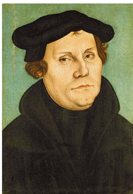
Bild: Atelier/Werkstatt von Lucas Cranach der Ältere (1528) / Wikimedia Commons, Public Domain

Der Protestantismus kann hier ein Korrektiv anbieten – sofern er sich nicht länger primär als Hüter einer vorgegebenen Ordnung versteht, sondern als kritischer Begleiter einer Freiheit, die immer gefährdet bleibt. Dann ließe sich die eingangs aufgerufene Meistererzählung korrigieren, ohne sie schlicht zu verwerfen. Der Protestantismus hat zur Entfaltung moderner Freiheitskulturen beigetragen – nicht durch heroische Emanzipationsakte, sondern durch das stetige Ringen mit der eigenen Ambivalenz. So verstanden bleibt er ein Ort, an dem Freiheit nicht nur gefeiert, sondern geprüft wird: auf ihre Voraussetzungen, ihre Grenzen und ihre Gefährdungen. Vielleicht liegt gerade darin seine eigentliche Stärke. Er hütet die Freiheit, indem er sie nicht romantisiert, sondern als Gabe und Aufgabe zugleich begreift. ■