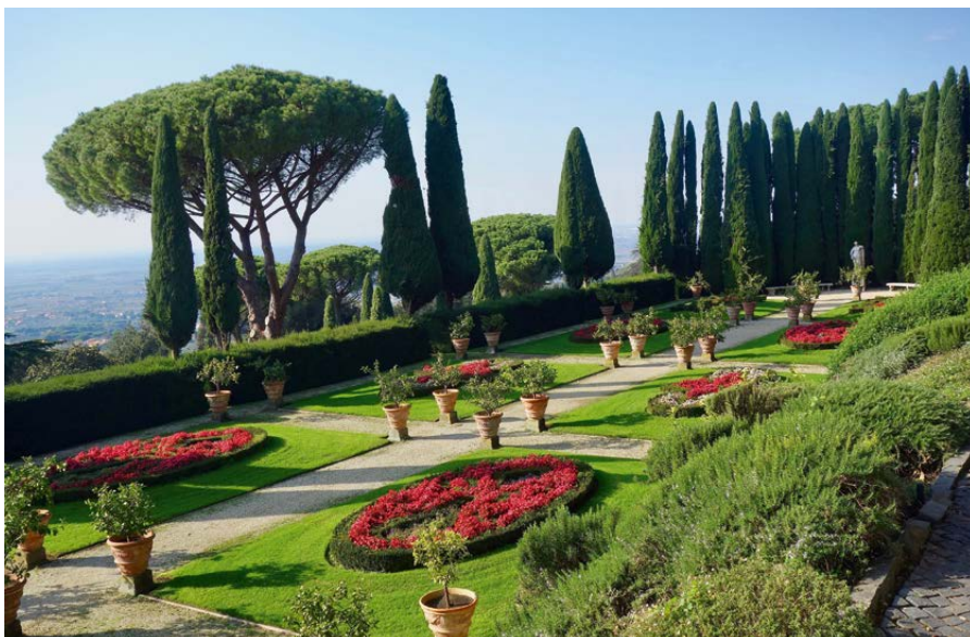
In Castel Gandolfo, hier der Park der Sommerresidenz der Päpste, hat Papst Franziskus das Öko-Zentrum Borgo Laudato si' eingerichtet. Das Dorf ist direkt dem Papst unterstellt.

tischen Projektionsfläche. Der erste US-amerikanische Papst (mit peruanischer Staatsbürgerschaft) steht in vielen Punkten in thematischer Kontinuität zu Franziskus, wenn auch mit einem anderen Stil.