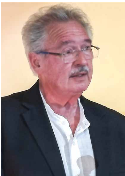
Jean Asselborn , ehemaliger Außenminister Luxemburgs

bei dem viele in Deutschland direkt Zuckungen bekommen. Nämlich die Entscheidung zu treffen und mitzutragen, dass die großen Mittel, die man für eine europäische Wirtschaftspolitik braucht, vielleicht auch Mittel sein können, ja müssen, die durch große Anleihen zu beschaffen sind. Europa leistet auch heute noch 50 Prozent aller weltweiten Entwicklungshilfe. Das ist eine gewaltige Leistung. Und was