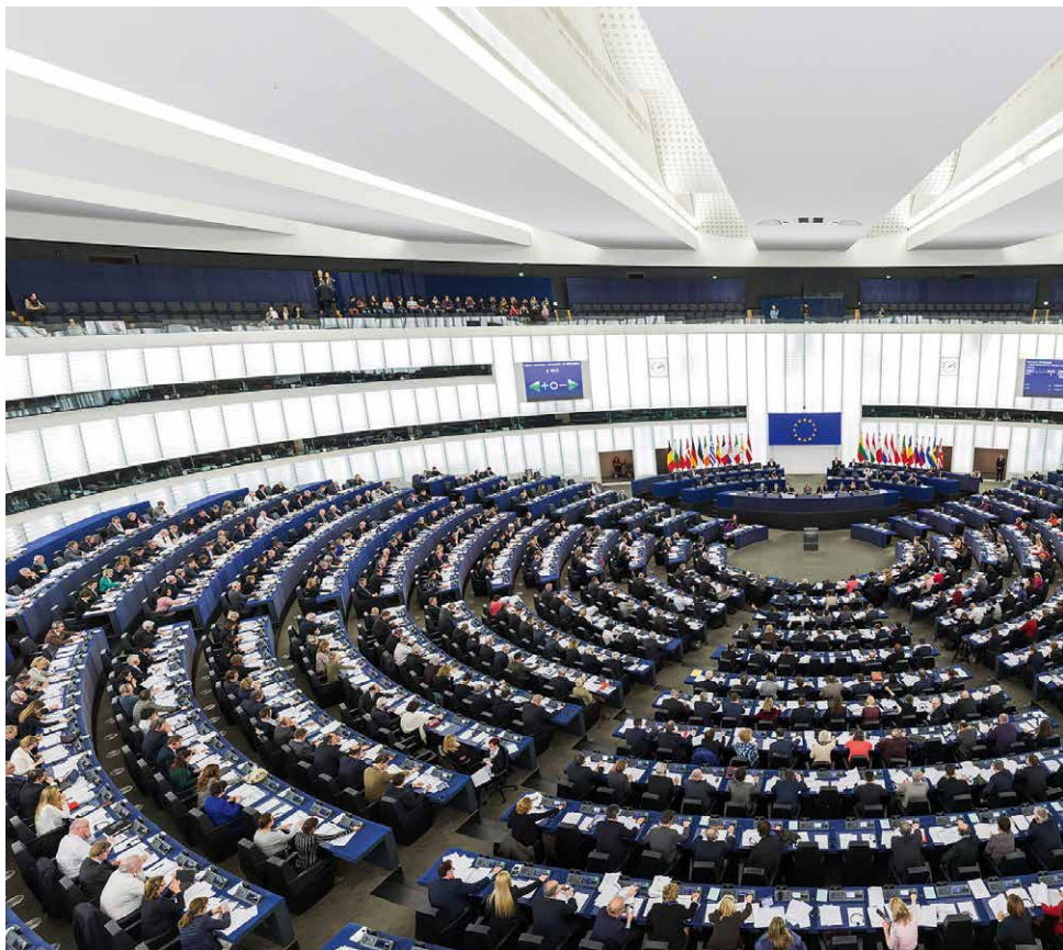
Das Europäische Parlament hat seinen offiziellen Sitz in Straßburg. Das Parlament der Europäischen Union wird direkt von den Bürgerinnen und Bürgern der EU gewählt und ist das zentrale Organ der europäischen Politik.

Wenn wir in Europa nicht imstande sind, das Nötige zuverlässig zu liefern, dann wird die Ukraine eines Tages nicht mehr bestehen. Die Ukraine kann diesen Krieg nicht stoppen, sie muss ihn überleben.