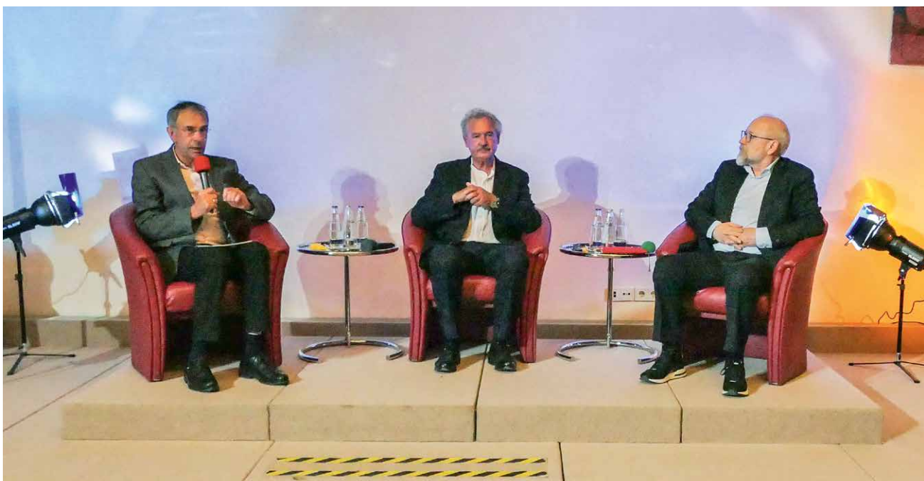
In der anschließenden Diskussion waren sich der Politiker Jean Asselborn (Mi.) und der Politikwissenschaftlicher Herfried Münkler (re.) einig, dass Europa nur Einfluss behalten kann, wenn die Staaten intensiv zusammenarbeiten und die EU weiterhin eine koordinierende Rolle einnimmt.

Ich meine, das allererste wäre, dass die Ukraine dann Mitglied in der NATO werden müsste. Ich rede hier