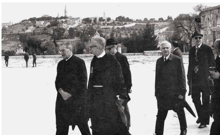
Der damalige Professor Joseph Ratzinger als Teilnehmer einer Studien- und Kontaktreise der Katholischen Akademie in Bayern nach Israel; hier mit Julius Kardinal Döpfner (links) auf dem Tempelberg in Jerusalem; im Februar 1975.

Wir machen uns heute kaum noch eine Vorstellung, wie die Stellung eines deutschen Ordinarius an der Universität aussah. Etwas zugespitzt lässt sich sagen: Er war von fast gottgleicher Würde, de facto unfehlbar, unbestreitbar nahezu allmächtig. Jetzt aber skandierten die Hörer*innen (!): „Unter den Talaren der Muff von tausend Jahren“. Sie legten sich auf die Stufen der Treppen, die zu den Professorenbüros führten; sie brüllten die Dozenten im Hörsaal nieder, sie demütigten sie auf alle erdenklichen Arten.