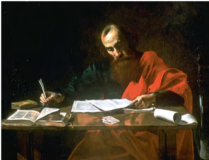
Eine Abbildung des Apostels Paulus: Die Vorgänge in Antiochia führten zu einem Zwist zwischen Paulus und Petrus, bei dem Paulus dem Apostel Petrus vorwarf, von der „Wahrheit des Evangeliums“ abzurücken (Gal 2,14a).

Als nun die Delegation aus Antiochia mit dem Ergebnis des Jerusalemer Treffens in ihre Gemeinde zurückkehrte, sah man dort den eigenen theologischen Standpunkt durch die Vereinbarung bestätigt. Wenn aber heidnische Menschen ohne Auflagen getauft und in die Gemeinde aufgenommen werden durften, war es nur folgerichtig, dass sie auch gleichberechtigt mit den christusgläubigen Juden in der Gemeinde zusammenlebten. Ein solches Zusammenleben konkretisierte sich besonders durch die Tischgemeinschaft bei der Feier des Herrenmahls. Die christusgläubigen Juden mussten dazu jedoch die religionsgesetzlichen Hürden, die ein gemeinsames Essen mit nichtjüdischen Men-