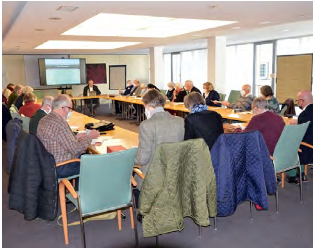
In einem der Arbeitskreise am Dienstagvormittag vertieften die Teilnehmerinnen und Teilnehmer die Kenntnisse über die Apostelgeschichte und reflektierten die Vorträge vom Montag.

schen zumindest erheblich einschränkten, missachteten. In Antiochia sah man dies offenbar durch die Jerusalemer Vereinbarung gedeckt.