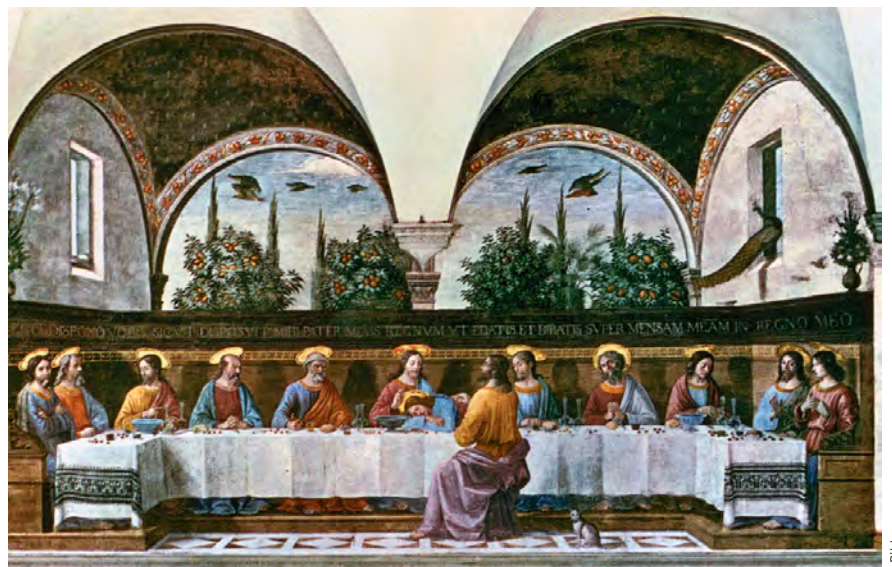
Jesus erschien auch den versammelten Aposteln. Diese Erscheinung dürfte die Zwölf veranlasst haben, die vorösterliche Verkündigung Jesu an Israel wieder aufzunehmen. Denn nichts symbolisierte so sehr wie der Zwölferkreis die Absicht Jesu, Israel als Zwölfstämme-Volk für die endzeitliche Herrschaft Gottes zu sammeln.

Charakter gewinnt die Verkündigung an nichtjüdische Menschen zuerst im syrischen Antiochia. Dort begannen laut Apg 11,19f einige der aus Jerusalem vertriebenen hellenistischen Christusgläubigen, die aus Zypern und Zyrene stammten, das Evangelium auch an Heiden zu verkünden. Interessanterweise findet sich in Apg 13,1 eine als historisch belastbar geltende Namensliste von Propheten und Lehrern, bei denen es sich wohl um die Mitglieder des Gemeindeleitungsteams in Antiochia handelt. An erster Stelle steht hier