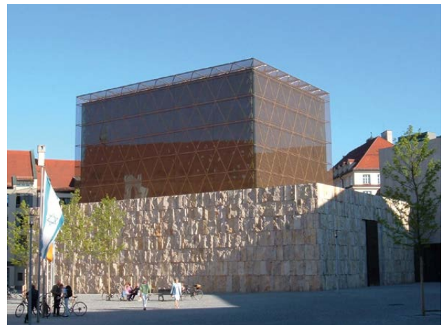
Die Münchener Synagoge Ohel Jakob ist ein zentraler Ort jüdischen Lebens in München und Oberbayern.