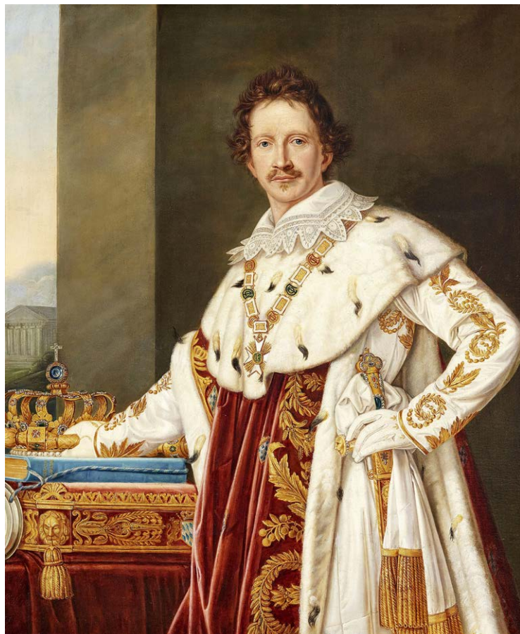
Bild: Nach Karl Joseph Stieler (19. Jh.)

Ludwig startete mit etlichen Handicaps ins Leben: Er kam mit einem Sprachfehler auf die Welt, der nie ganz verschwand und bei dem Zehnjährigen verschlechterte sich das Gehör. Er musste also von Kindheit an mit körperlichen Beeinträchtigungen zurechtkommen.