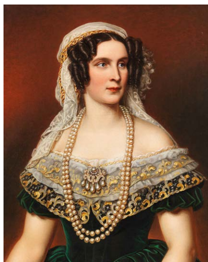
Bild: Karl Joseph Stieler (1855)