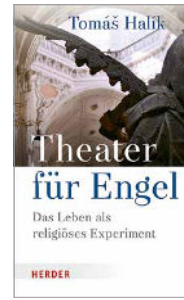
Theater für Engel. Das Leben als religiöses Experiment , Autor Tomáš Halík.

der das reguläre zweite Halbjahr der Akademie. Leider war es dann ja nur eine kurze Zeit mit „normalem“ Programm.