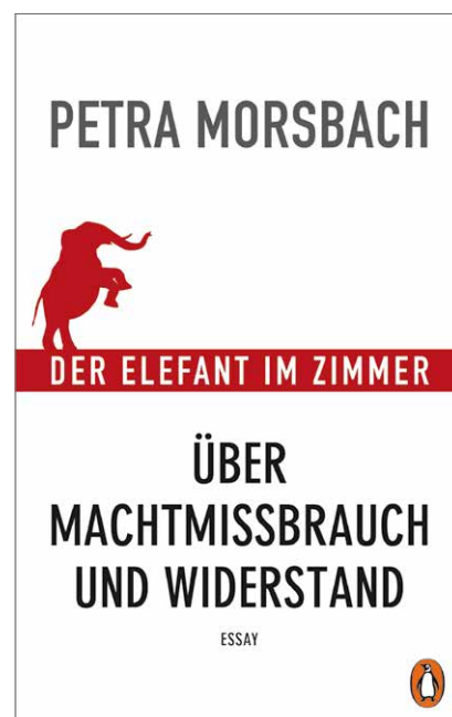
Petra Morsbach, Der Elefant im Zimmer. Über Machtmissbrauch und Widerstand , Penguin Verlag, 2020.

Details kaum vermittelbar, doch im Kern geht es um die Frage, ob Schriftsteller formale Befehle oder Verbote befolgen müssen. Ich bin überzeugt, dass nicht: Die Hierarchiefreiheit ist ja gerade der Witz der Schönen Literatur, und darin besteht auch ihre gesellschaftliche Funktion: zu einer Welt der kollektiven Strukturen, Abhängigkeiten und Tabus eine freie Deutung des Lebens beizutragen. Diese Deutung ist weder richtiger noch wichtiger als andere Deutungen, bildet aber ein Gegengewicht, gewissermaßen als Anwältin der Seele. Aus gesellschaftlicher Perspektive ist die Seele vielleicht nur die kleinste humane Einheit, doch ihr entspringen wesentliche Antriebe: die Sehnsucht nach Gerechtigkeit, Vertrauen, Liebe, Schönheit, Sinn; und