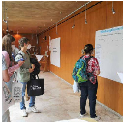
Mit Punkten konnten die Teilnehmer*innen Zustimmung oder Ablehnung zu vorformulierten Thesen artikulieren – es entstand ein Stimmungsbild. Rechts: Die Romano-Guardini-Bibliothek bot ebenfalls Platz für Workshops: Dort konnte man in einer eher ruhigen Atmosphäre zusammenkommen.