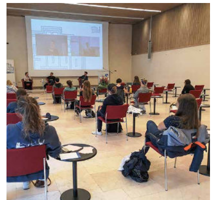
Oben: Die München 2040 -App stellte – neben ihren anderen Funktionen – außerdem sicher, dass die Veranstaltenden wussten, wer mit wem im selben Raum gewesen war. Unten: Wer beteiligt sich alles an München 2040 ? Das wird mit jedem Faden, der auf der Schautafel gespannt wird, deutlicher.