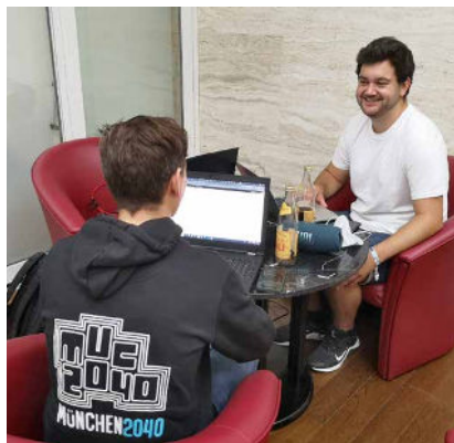
Die IT, die die Kommunikationstechnik am Laufen hielt, hatte ihre Zentrale im Clubraum unseres Tagungshauses eingerichtet. Mitte: Auch Pause musste mal sein – schließlich gibt es neben der sicher wichtigen Zukunft auch noch eine schöne Gegenwart. Rechts: Neben dem Schloss hat die Akademie auch noch den Viereckhof zu bieten – im Garten davor war Platz für einen Workshop.

Zwar fand dieses Angebot deutlich weniger Anklang als erhofft, die Malteser aber zeigten sich gelassen und dankbar für die Unterstützung durch die Katholische Akademie, die neben der Stromversorgung des mobilen Impfzentrums auch in der Bewirtung dieser besonderen Gäste, den Mitarbeiter*innen des Impfteams, bestand.