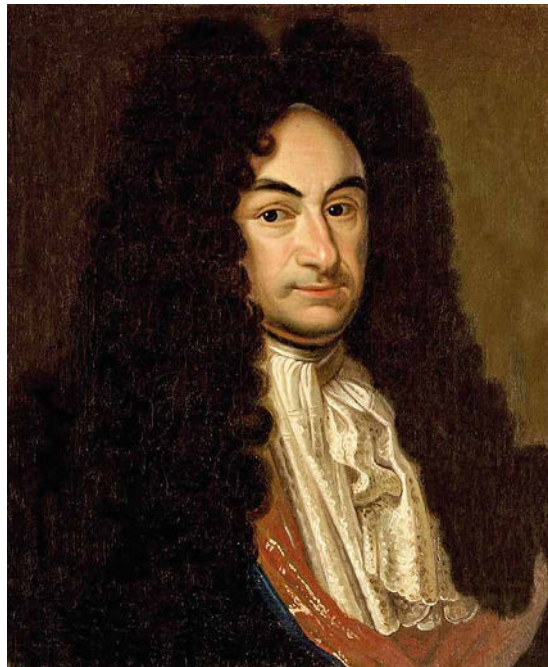
Dieses Gemälde des Hannoveraner Hofmalers Andreas Scheits aus dem Jahr 1703 zeigt den Theologen Gottfried Wilhelm von Leibniz. Leibniz stand in Diensten des Hofes in Hannover.

Im dritten Teil spricht er die Mysterien des christlichen Glaubens an, also die Offenbarungsinhalte, die der Vernunft nicht zugänglich sind. Für diese projiziert er den