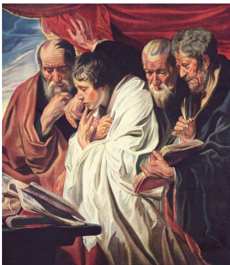
Bild: Jacob Jordaens (um 1620) / Wikimedia Commons, Public Domain

ohnmächtig leidende Jesus ist der vollmächtige Christus. Und um die Bedeutung des Kreuzesgeschehens zu verstehen, bedarf es des Blicks auf das ganze Evangelium als heilige Geschichte und Grundlage des Glaubens. Mit dieser doppelten Paradoxie korrespondiert die Rahmung der Evangelienzählung in Mk 1,1 und 16,7. Und wenn man die gesamte markinische Geschichte vom Wirken und von der Passion des irdischen Jesus im Lichte des Osterglaubens schließlich bis zu ihrem Ende gehört hat, dann wird man aufgefordert, sie noch einmal von vorn zu hören oder zu lesen, um immer besser zu verstehen, wer dieser Jesus eigentlich ist. ■