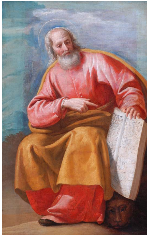
Der Maler Giuseppe Leonardo setzte den Evangelisten Markus mit dem Buch in der Hand und dem Löwen zu dessen Füßen – die beiden Attribute des Evangelisten – in Szene.

Deutliche Kritik an bestehenden religiös begründeten Normen bringt auch Mk 3,1–5 zum Ausdruck. Die Pointe dieses Heilungswunders besteht darin, dass akute Lebens-