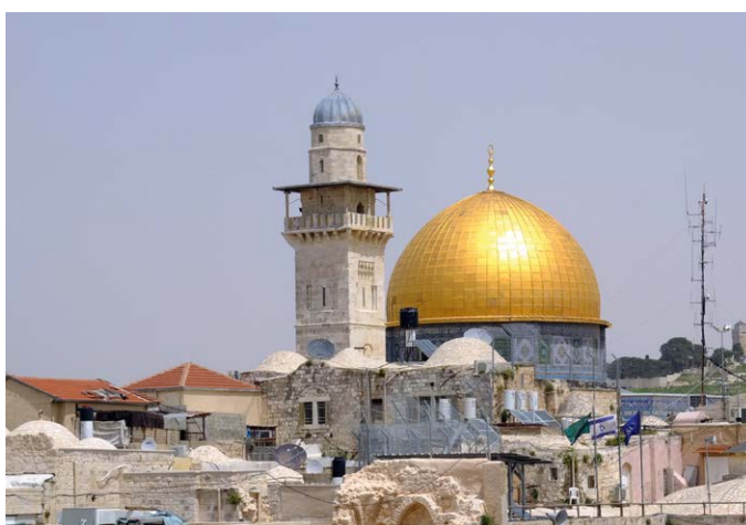
Im Israel-Palästina-Konflikt fungiert die Religion als Eskalationsfaktor. Der Blick auf den Tempelberg mit dem Felsendom ist das Symbol für die räumliche Verdichtung von Judentum und Islam.

8. Konflikte zwischen Menschen hat es immer gegeben und wird es immer geben. Religiöse Friedensstiftung