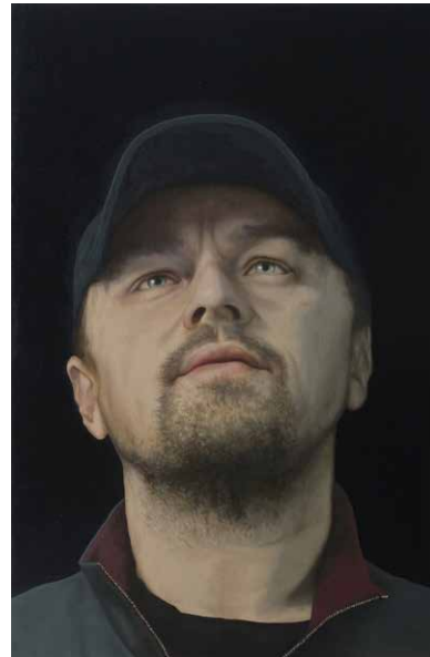
Toni Mauersberg, 2 Leonardo , verweist auf den großen Renaissance-Künstler und den berühmten Schauspieler Leonardo die Caprio. Das Werk entstand 2020, Öl auf Leinwand und Holz, 45 x 30 Zentimeter.

dem poetischen Titel, oder sagen wir: dem Motto der Doppel-Ausstellung: Im Augenblick des Staunens fällt das Ich mit der Welt in eins.