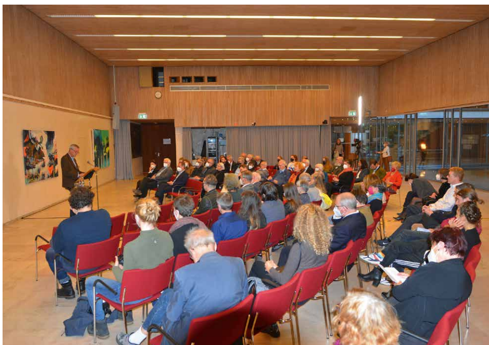
Mehr als 100 Kunstinteressierte waren am 5. Oktober 2022 zur Vernissage in den Vortragssaal der Akademie gekommen.

Betrachten wir beispielhaft ihr Gemälde Unter Palmen . Die Malerin führt uns mit diesem Bild, das sich einem Staunen zunächst zu entziehen scheint, keine Sehnsuchtslandschaft vor, keine tropische Idylle, keine Ro-