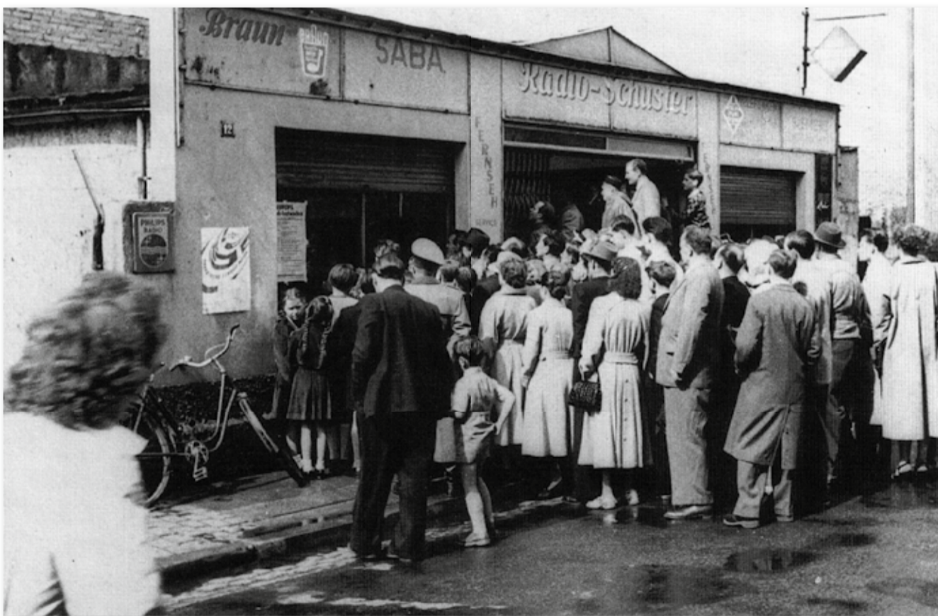
Unzählige Menschen in Deutschland verfolgten das Endspiel am 4. Juli 1954 vor Elektrogeschäften, in denen Fernsehgeräte liefen – hier ein Foto aus Kaisers-

Am einfachsten war die Frage nach der Flagge zu lösen. Hieran bestand der größte Bedarf, da der neu gegründete Staat bei offiziellen Anlässen auf eine Nationalfahne angewiesen war. Bereits 1949 entschied sich der Parlamentarische Rat für die Farben Schwarz-Rot-Gold, die auf die deutsche Einheits-