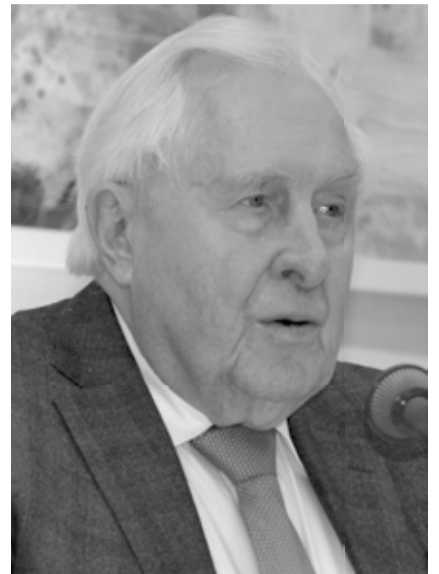
Prof. Dr. Bernhard Vogel, Ministerpräsident a. D. und Präsident a. D. des Zentralkomitees der deutschen Katholiken

Das Ende des Konzils löste zunächst für einige Jahre auch in Deutschland eine Phase des Aufbruchs aus. Die deutschen Katholiken befanden sich in einer