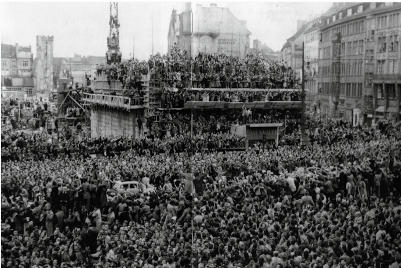
Überwältigender Empfang der Mannschaft in Deutschland: Auf dem Münchner Marienplatz war kein Durchkommen mehr.

Öffentlichkeit beschäftigten. Dazu gehörten die mehr als 1,5 Millionen Vermissten des Zweiten Weltkrieges, von denen vermutlich die weitaus größte Zahl verstorben war. Doch jeder Einzelne konnte hoffen, dass sein Vater, seine Mutter, seine Geschwister oder Freunde zu den Überlebenden gehörten und vielleicht bald gefunden würden. Ein anderes wichtiges Thema war die verbreitete Armut. Das Wirtschaftswunder hatte eingesetzt und erstaunliche Erfolge gezeigt, die jedoch nur teilweise unten ankamen. Vor allem Witwen, Waisen und Rentner mussten mit sehr geringen Beträgen auskommen. Mit dem Alter kam für viele die Armut.