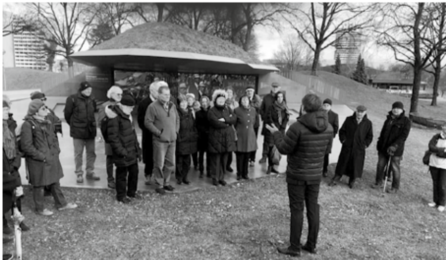
Die Teilnehmer*innen der Historischen Tage besuchten den Erinnerungsort des Olympia-Attentats im Münchner Olympiapark. Die „heiteren“ Olympischen

Alle Fäden, die den Menschen in der Vergangenheit in das soziale Netz eingeflochten hätten, seien durchtrennt worden. Da die traditionellen Verhaltensmuster und Konventionen gebrochen worden seien, seien allerdings nur zu häufig traumatische Verunsicherung und gegenseitige Verständnislosigkeit die Folge gewesen. Die durchaus zu verzeichnende Zunahme von Autonomie der Individuen sei schließlich mit einer zum Teil dramatisch angestiegenen Anomie der Gesellschaft bezahlt worden. □