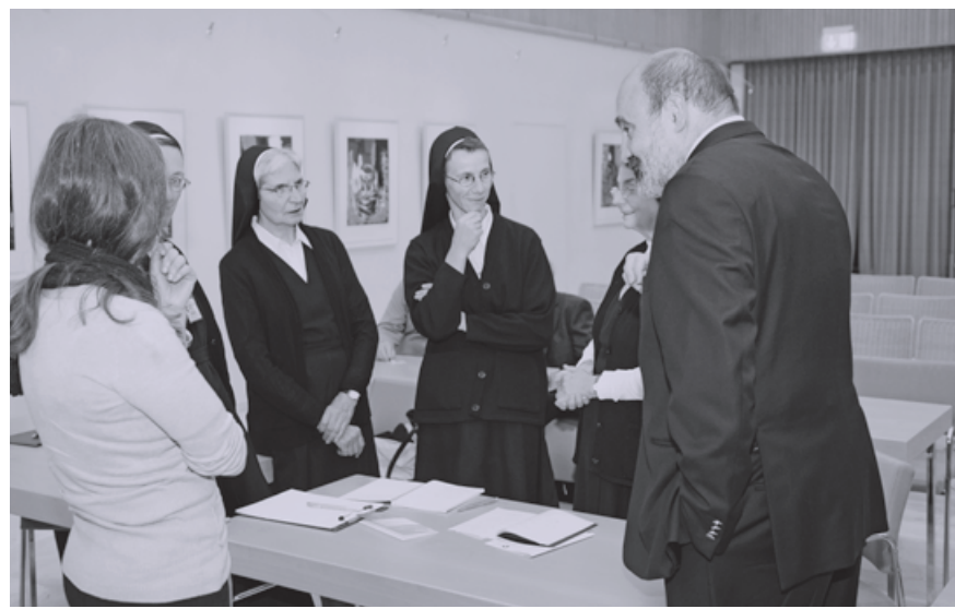
Professor Tomáš Halík, Träger des Romano Guardini Preises der Katholischen Akademie und immer wieder gern gesehener Gast im Haus, nutzte

Mir geht es darum, dass wir im Zuge des Triumphalismus und der billigen Tricks einer ausgeklügelten Apotheik