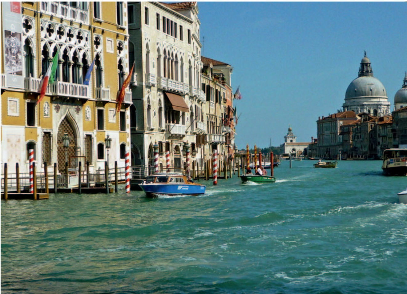
Eine der schönsten Städte der Welt: Blick auf den Canal Grande in Venedig.