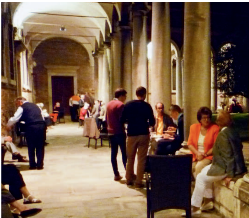
Die Exkursionsgruppe war im Hotel Centro Culturale Don Orione Artiglianelli untergebracht. Im Kreuzgang des