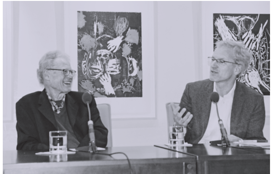
Die beiden Literaten kennen und schätzen sich sehr.

Lyriker einen Namen gemacht. In „Schwebstoffe“ (2004), „Wrist“ (2009) sowie zuletzt in „Old Glory“ holen Heinrich Deterings Gedichte „in ruheloser Neugier Welt und Geschichte in den Vers und feiern den Augenblick in der Ewigkeit“, wie es sein Verlag formuliert. „zur debatte“ veröffentlicht die Begrüßung durch den Gastgeber und zeigt Fotos des Literaturabends.