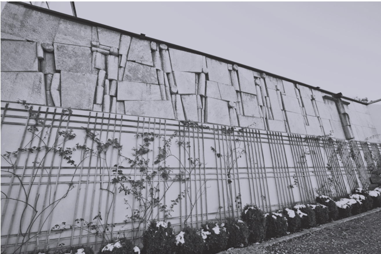
Das Relief „Vom Chaos zur Ordnung“ gilt als weithin sichtbares Wahrzeichen der denkmalgeschützten Akademie.