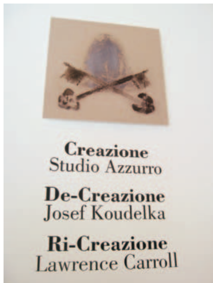
Der Eingang zum Pavillon des Heiligen Stuhls auf der Biennale.

Die Bürgerinitiativen des Lidos, die den Ausverkauf ihrer Insel nicht hinnehmen wollen, protestierten, der französische Konsul, der seit einem Viertel Jahrhundert in Venedig lebt, wagte es, den Tourismus in Venedig als Barbarei, den Karneval als Oktoberfest und die Stadtoberen als Schmierkomödianten zu bezeichnen. Die Bürgerinitiative 40 x Venezia organisierte Diskussionsveranstaltungen, und die Bürgerbewegung Movimento 5 Stelle, die mit ihren Mitstreitern in einer Art Abstellkammer der Ca' Farsetti sitzt, tut das, was im venezianischen Rathaus als Worst Case gilt: Fragen stellen. Von hier aus be-