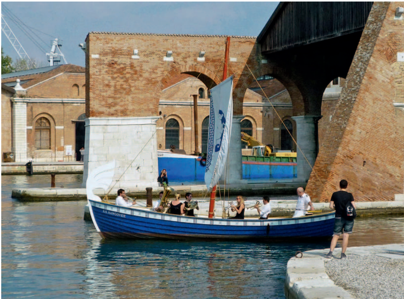
Das Boot fährt durch das Ausstellungsgelände des Arsenal: Auch dies war eine der Installationen im Rahmen der Biennale.

Ich erinnere mich noch an diesen eisigen Nachmittag, im März dieses Jahres, als ich am Giudecca-Kanal stand, auf der Insel Sacca Fisola, die von den Venezianern Pinguin-Insel genannt wird, weil dort immer ein eisiger Wind pfeift. Ein zwanzigstöckiger Wolkenkratzer schob sich durch die Lagune. 333 Meter lang. 60 Meter hoch. 38 Meter breit: Die MSC Divina hatte die Kreuzfahrtsaison in Venedig eröffnet.