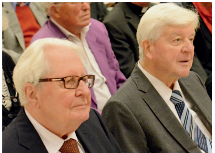
Zwei Männer, die politisch und kirchlich eng mit Kardinal Julius Döpfner zusammenarbeiteten: Dr. Hans-Jochen Vogel (li.) und Prof. Dr. Hans Maier.

Das ist eigentlich gemeint mit den Worten des Konzils, dass die Kirche Instrument der Einheit, Werkzeug, Sakrament der Einheit der Menschen untereinander sein soll, und zwar global – und der Einheit mit Gott. Dass das nie alle Menschen sichtbar umfasst, jedenfalls auf absehbare Zeit, ist uns klar.