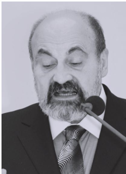
Prof. Dr. Tomáš Halík, Professor für Soziologie an der Karlsuniversität in Prag und Präsident der Tschechischen Christlichen Akademie

Einige Soziologen behaupten, die Religion im Westen verwandele sich in Spiritualität. Nachdem der Protestantismus versucht hatte, dem Christentum alles „Mönchische“ auszutreiben, ergoss sich die kontemplative Dimension des religiösen Lebens spontan in die Musik, in die Oratorien von Bach und Schütz.