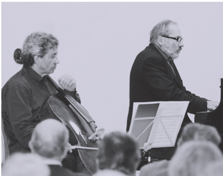
Die beiden Musiker interpretierten Robert Schumann und Claude Debussy.