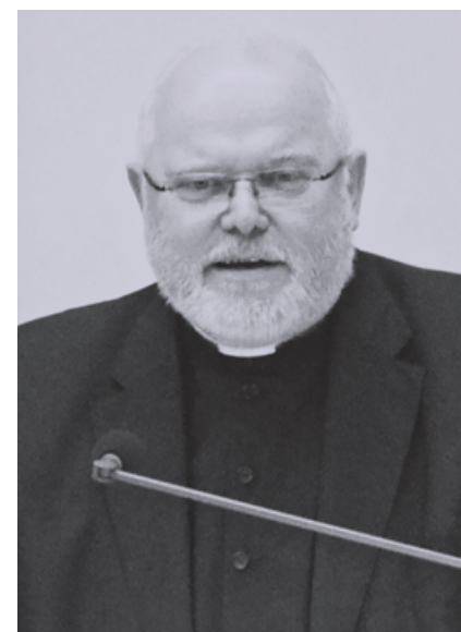
Reinhard Kardinal Marx, Erzbischof von München und Freising

Ich möchte in einem ersten Teil – ich bin kein Historiker und hier sind Fachleute, die das besser sagen können – dennoch einen historischen Blick auf Julius Kardinal Döpfner werfen. Historische Größe ist ja von dreierlei abhängig, zunächst einmal davon, ob eine Persönlichkeit in sich Stärke, Überzeugungs-