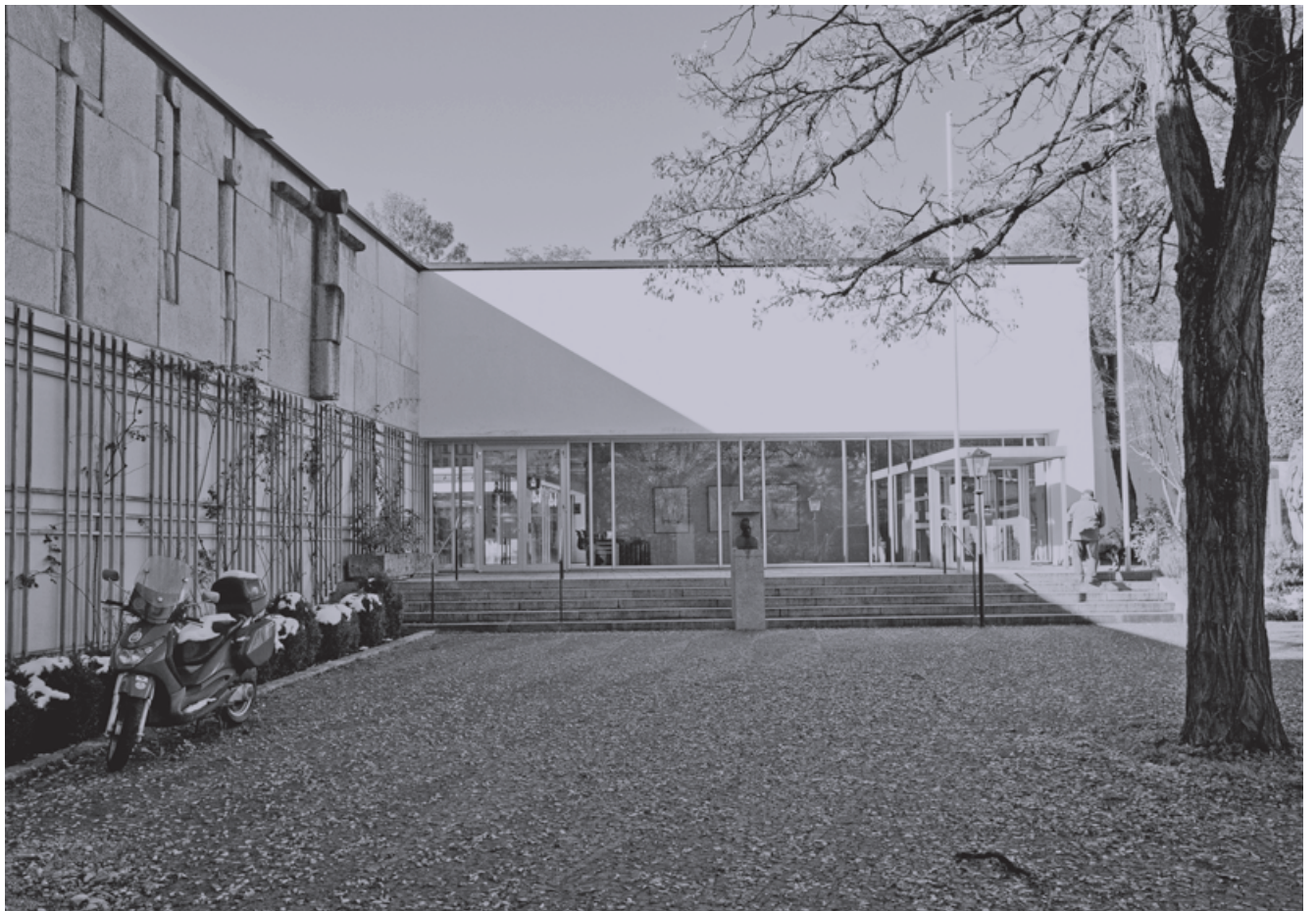
Der Eingang der Akademie an der Gunezrainerstraße. Es ist geplant, in Zukunft an der Gunezrainerstraße den Haupteingang mit der Rezeption zu etablieren.

Für weitere Fensterelemente wird der Einsatz von hochgedämmten 3-fach verglasten Konstruktionen geplant, die mit einer dezentralen Lüftungseinheit mit Wärmerückgewinnung gekoppelt werden können. Pfosten-Riegel-Fassaden werden, wie im Bestand bereits begonnen, als schlanke hochdämmende Verglasung fortgesetzt. Fassadenabschnitte mit hochwertigen Oberflächen wie das