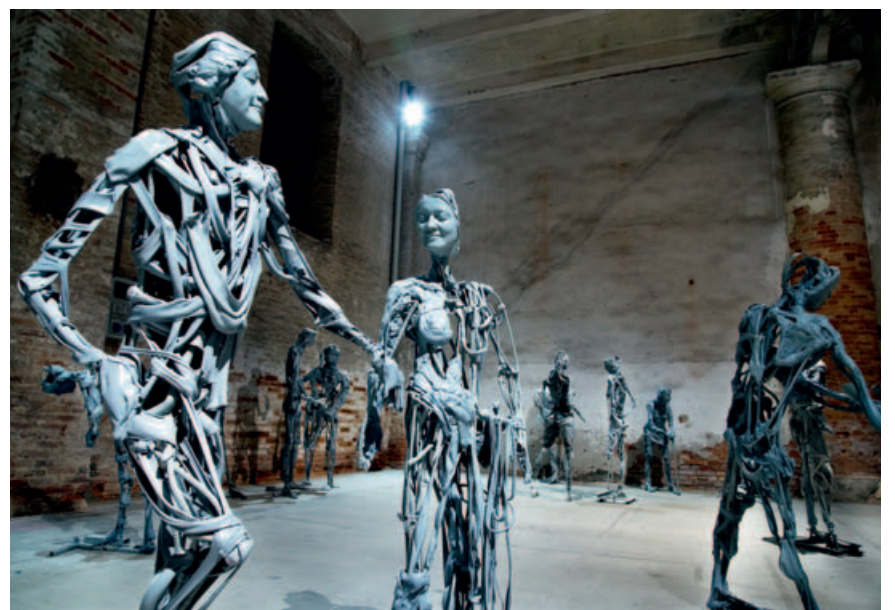
Auch diese Installation von Pawel Althamer fand im Arsenalen ihren Platz. Der polnische Künstler will mit seiner