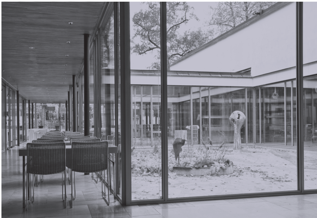
Der Lichthof mit dem Brunnen ist ein besonders schöner Teil des Kardinal Wendel Hauses. Die Glasfassaden und das Dach des benachbarten Atriums lassen allerdings viel Kälte herein.

Da kommt die Deutsche Bundesstiftung Umwelt ins Spiel. Für die bisherige Förderung und die hervorragende Zusammenarbeit bei dieser Grundlagenstudie vielen Dank. Die entstandene integrale Studie ist für uns von enormer Wichtigkeit und Bedeutung im Hinblick auf weitere Planungen und sie ist ein Leitfaden für unser Konzept „Akademie 2020“. Darin enthalten sind die dringend notwendigen Renovierungs- und Sanierungsmaßnahmen der nächsten Jahre. Darin enthalten sind auch Ideen für die Verbesserung der Arbeitsabläufe, und auch, wie sich Menschen, die hier täglich ein- und ausgehen, wohlfühlen, genauso wie die Menschen, die hier arbeiten. □