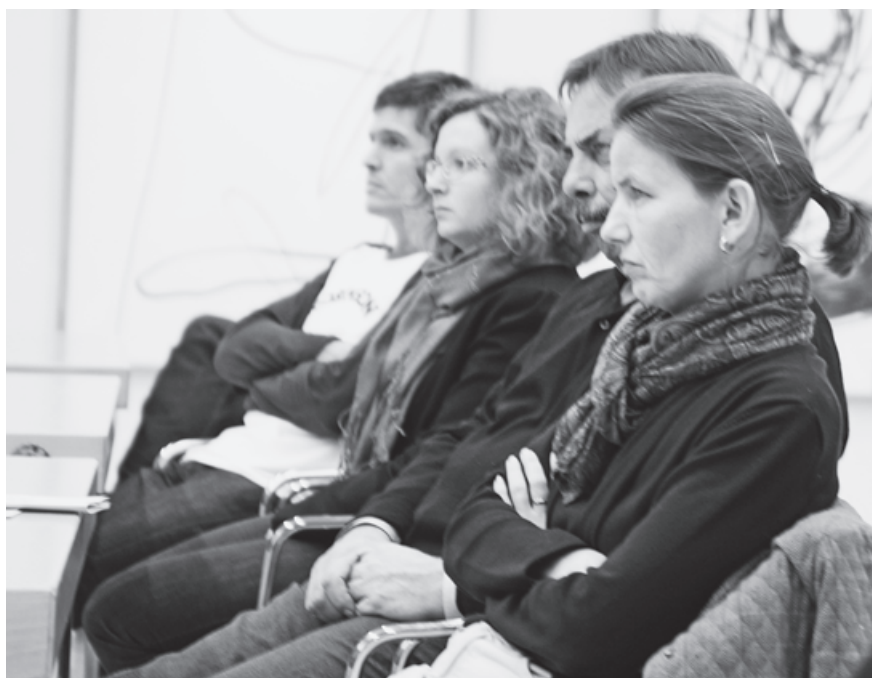
Aufmerksam verfolgten die Zuhörer Vorträge und Diskussionen.

Zwar wird das Nutzerverhalten als ideal vorausgesetzt. Das richtige Verhalten der Nutzer ist allerdings für die optimale Funktionsfähigkeit unerlässlich.