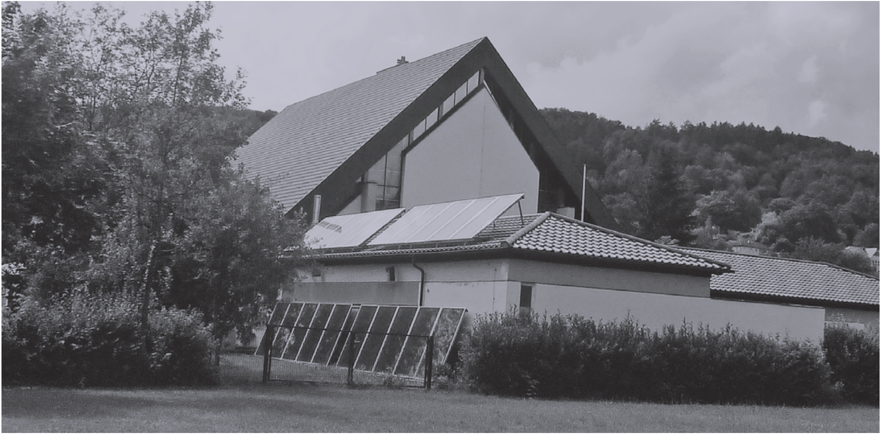
Die Schutzengelkirche in Gräfen Dorf ist eines der besonders gelungenen Beispiele für eine energetische und dennoch den Denkmalschutz beachtende Sanierung einer Kirche.

angeblich „neuer Technik“. In beiden Kirchen handelte es sich jedoch um eine sehr einfache und gebräuchliche Technik mit viel weniger Gesamtrisiko. Damit ist gemeint, dass bei einer Ölheizung zuerst sehr aufwändige Bohrungen im Meer oder in Krisengebieten mit enormem technischen Aufwand erfolgen – und dass dann das gewonnene Rohöl mit hohem technischen Aufwand zur Raffinerie transportiert werden muss, dort chemischen Verfahren unterworfen wird und anschließend über Straßentransport in ein örtliches Lager gebracht wird. Auch ein Ölbrenner verfügt über eine aufwändige Technik, die man jedoch für selbstverständlich hält.