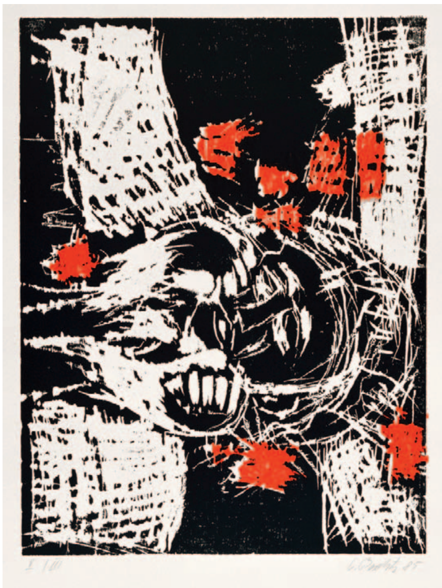
Insgesamt 15 Köpfe, alles Holzschnitte, sind in der Ausstellung zu sehen. „Von vorne“ heißt dieses Werk aus den Jahren 1985 bis 1988.

Copyright für die abgebildeten Werke: Georg Baselitz