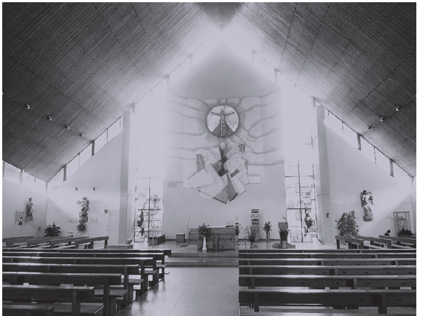
Der Innenraum der Kirche in Gräfen Dorf: Vor der Sanierung verbrauchte man bei einer Nutzfläche von 735 m 2 und ca. 8.000 m 3 umbautem Raum jährlich zwischen 7.000-10.000 Liter Öl.

Durch entsprechende Betrachtung der Energie-, Zins- und Reparaturkosten der letzten 30 Jahre des Bestandsgebäudes und einer Lebenszyklusbetrachtung der zukünftigen 30 Jahre gelingt, bei entsprechend hoher Einsparung durch Dämmung in Verbindung mit kostenloser Umweltenergie, in der Regel der Nachweis, dass die Mehrinvestition am Anfang über die gesamte Betrachtungszeit in Verbindung mit den heutigen niedrigen Zinsen eine „rentable“ Verschuldung darstellt. D. h. die Sanierungskosten können durch eingesparte Nachfolgekosten im Vergleich zum Bestand zum Teil refinanziert werden. Durch diese Effekte gelingt es, die zukünftige Generation von Nachfolgekosten technischer Nachrüstungen im Gebäude sowie von Umweltbelastungen zu entlasten und gleichzeitig ein im Gebrauchswert verbessertes Gebäude zu nutzen. □