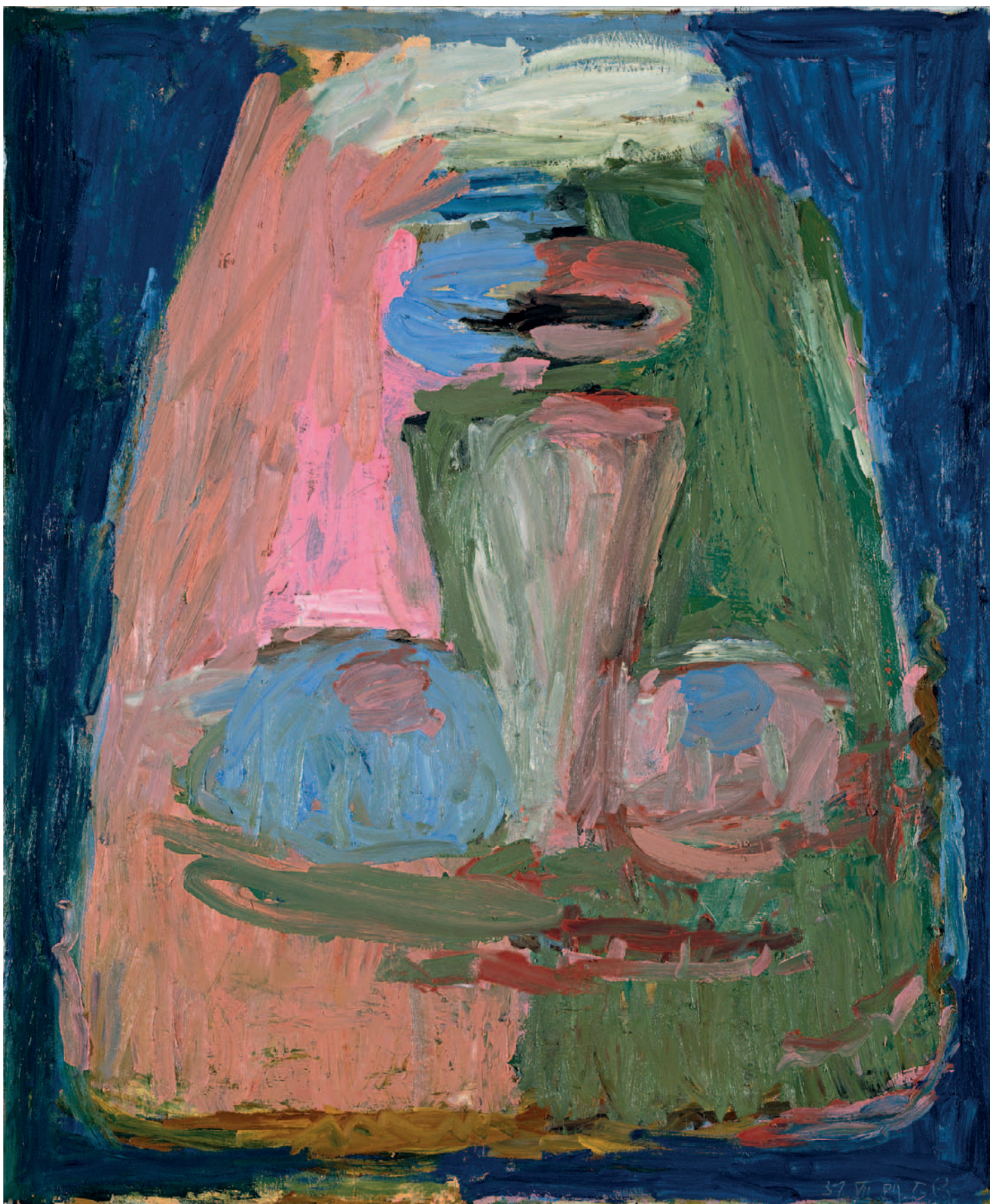
Der Abgarkopf, 1984 Öl auf Leinwand, 200 x 165 cm

Copyright für die abgebildeten Werke: Georg Baselitz