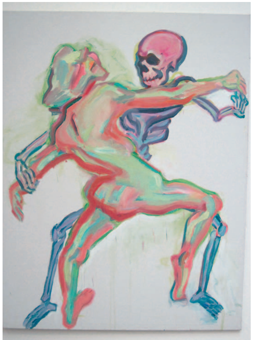
„Totentanz“: Das Gemälde von Maria Lassnig gehört zu den Werken, die im Arsenal zu sehen sind.