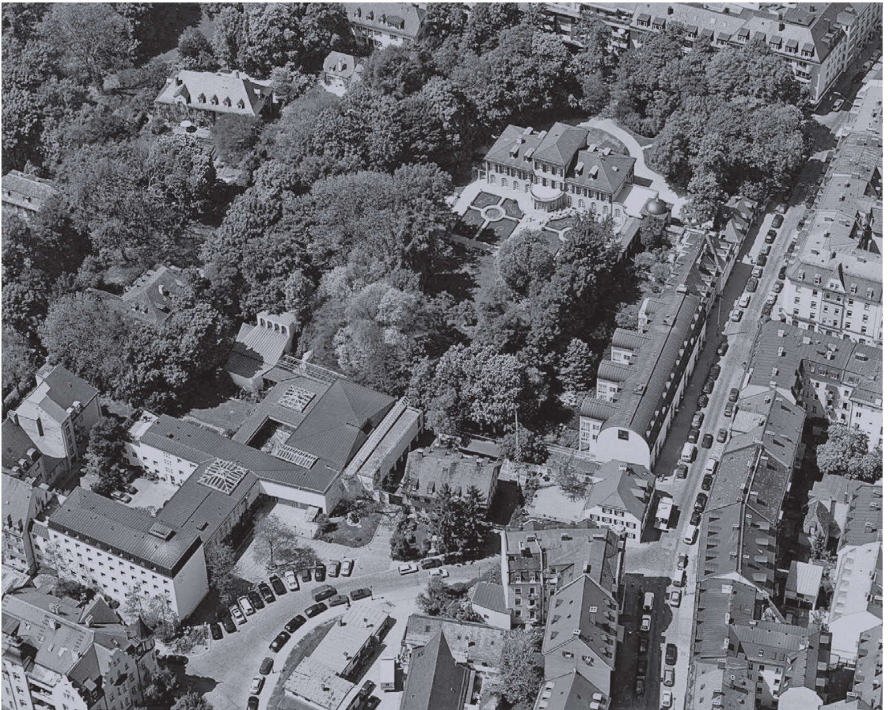
Das Luftbild zeigt das Gelände der Katholischen Akademie mit all ihren Gebäuden und dem Schloss Suresnes, das auch von der Akademie genutzt wird.

Falsches Nutzerverhalten wird als Störung angesehen. Deshalb gibt es zynischerweise den „Störfaktor Mensch“. Ein Störfaktor ist zwar rechnerisch ausgeschlossen. Jeder Fachkundige bestätigt aber, dass ein falsches Nutzerverhalten bestenfalls mit einem Faktor 2 bewertet werden kann. Bestenfalls heißt aber, dass er durchaus höher ausfallen kann. Diese Strategie ist Stand der Technik und wegen der einfachen statischen Berechnungsmodelle, der einfachen Bilanzier- und Planbarkeit strukturell so in unsere Genehmigungsstandards eingebaut und umgesetzt, dass sich kaum jemand dieser Methode widersetzen will.