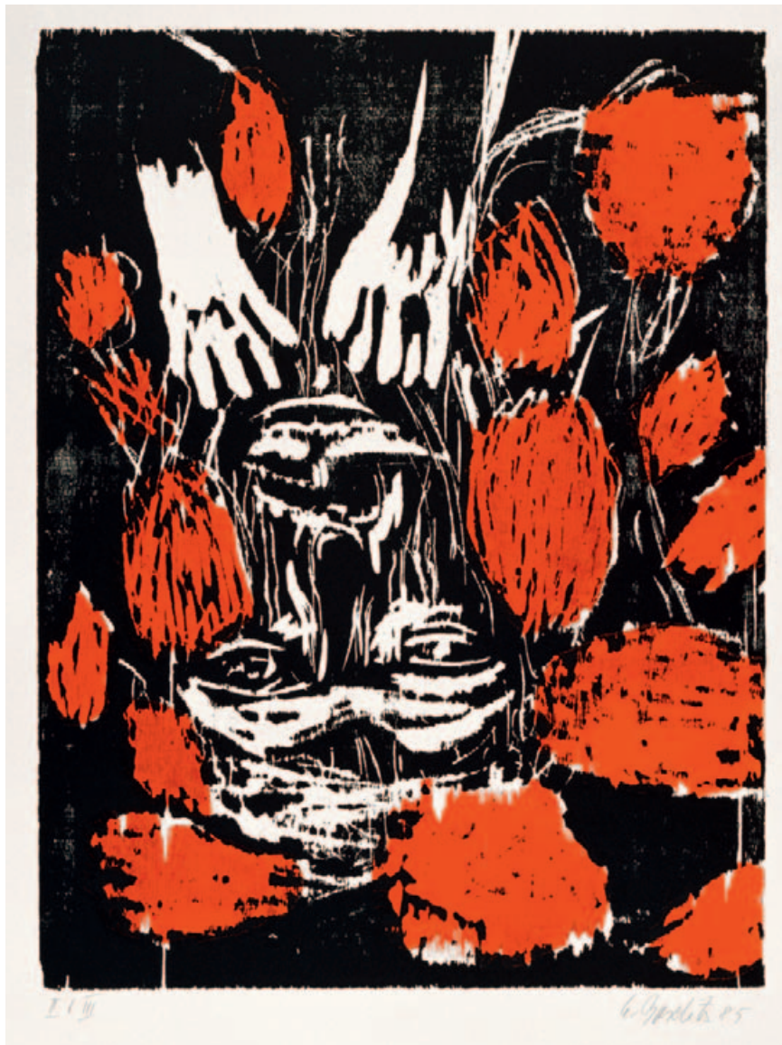
Sterne (Weinender Kopf) , ist der Titel dieses Werks, eines Holzschnitts von 2 Stöcken aus dem Jahr 1985.